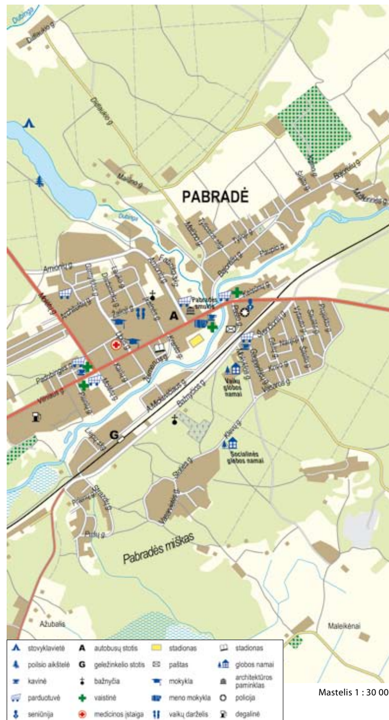
Mastelis 1 : 30 000