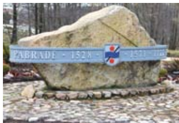
Paminklinis akmuo Dubingėlės skvere

• Nuo 1994 m. buvusioje gamyklos „Modulis“ teritorijoje savo veiklą aukštųjų technologijų srityje pradėjo vienkartinės kvėpavimo sistemas gaminanti Didžiosios Britanijos antrinė įmonė „Intersurgical“.