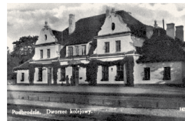
Pabradės geležinkelio stotis 1938 m.